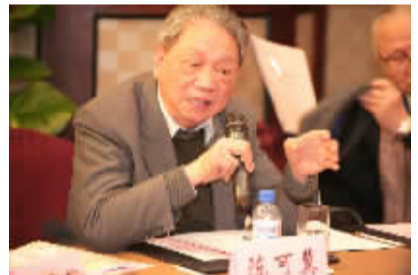
陈可冀院士:血脂康是中西医结合50年来的四大成果之一