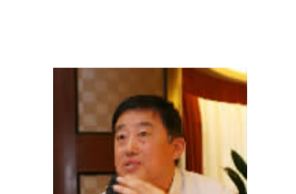
南京医大一附院黄峻教授认为血脂康是中国医生调脂防治冠心病的安全选择