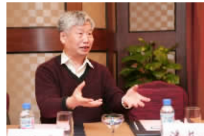
国家九五课题“血脂康调整血脂对冠心病二级预防研究”负责人、阜外医院陆宗良教授介绍课题研究过程